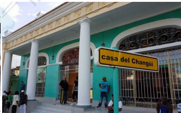
Casa del Changüí Guantánamo

19h30 : Dîner avec musique live à la Casa del Changüí . Avant de laisser la place à un groupe représentatif du genre sur scène, un musicologue local expliquera les détails de ce rythme de Guantanamo, et qui trois siècles plus tard conserve les instruments à timbre sonore de ses débuts, tels que le tres, le bongó, la marímbula, le guayo métallique et les maracas.