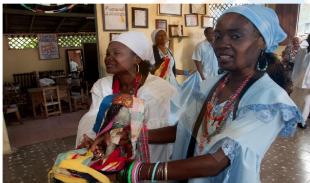
Tumba Francesa Santa Catalina

16h30 : Visite de la Société Tumba Francesa Pompadour , située dans le quartier typique de Loma del Chivo, où un représentant de cette association vous expliquera les particularités du genre, qui a émergé dans le voisin Haïti et trouve ses origines dans les danses de salon françaises transmises par les esclaves. Ensuite, un spectacle avec ce folklore, qui se distingue par la beauté des danses et les vêtements colorés de ses danseurs et danseuses.