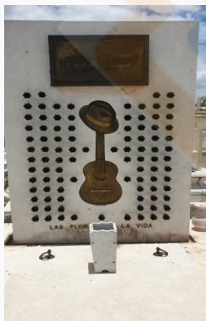
Tombeau de Compay

10h00 : Visite du Cimetière Santa Ifigenia en suivant "El Sendero del Trovador" où reposent des figures légendaires de la musique cubaine. Nous assistons à la cérémonie de la relève de la garde devant le Mausolée de José Martí (héros national et apôtre de la lutte pour l'indépendance).