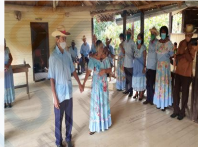
Danse Tumba Francesa

9h00 : Départ pour Punta de Maisí , où "Cuba commence". Pendant le voyage, il y aura un arrêt dans le canyon de Yumurí , où on pourra apprendre davantage sur sa légende et son mysticisme, apprécier ses eaux émeraudes, les plantations et la végétation exubérante qui l'entourent.