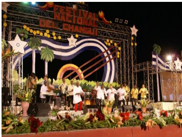
Groupe de Changüí