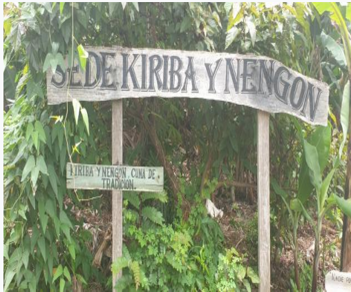
Communauté El Güirito

et du Kiribá, deux rythmes indigènes de la région considérés comme les gènes du son et du changüí.