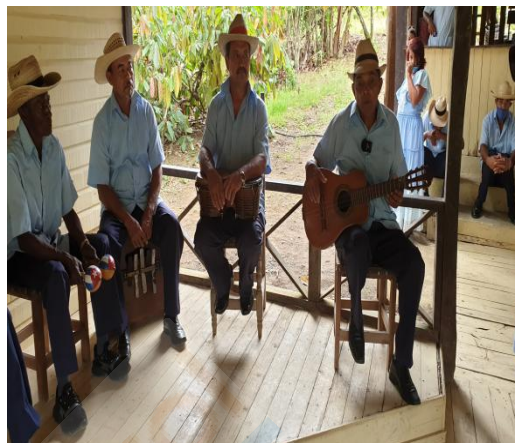
Musiciens de la communauté d'El Güirito