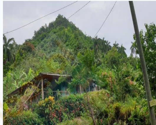
Siège du Nengón et Kiribá à Baracoa

Le célèbre groupe local qui préserve et donne la continuité à un héritage musical aussi extraordinaire effectuera une démonstration de ces genres ancestraux, à la fois musicalement et dans la danse, invitant les visiteurs à suivre les traces de ces rythmes dans un mélange sensationnel d'authenticité, de culture et de cubanisme.