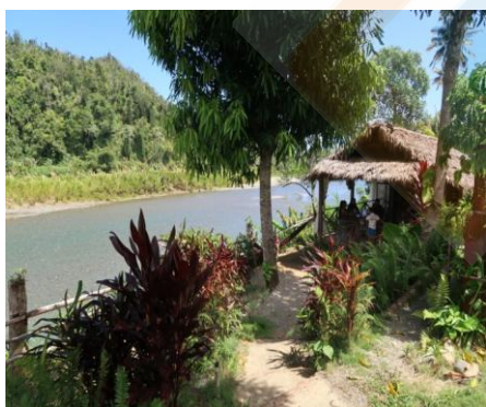
Casa Toa au bord de la rivière Toa

09h00 : Départ vers la ville de Baracoa, la ville dite des primates. Le voyage mérite une mention spéciale, à travers une route étroite et verdoyante appelée "La Farola", dont les paysages verdoyants et tropicaux mériteront plus d'un arrêt pour prendre des photos. Vers midi, arrivée à Baracoa, la première ville fondée à Cuba en 1511.