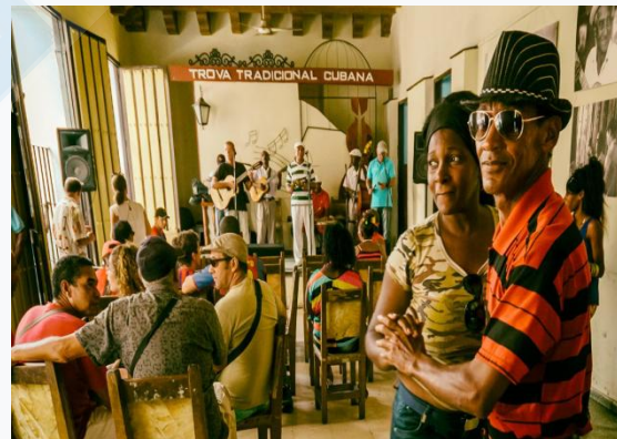
La Casa de la Trova

20h30: Diner à la Bodeguita del Medio . Bar et restaurant mythique à La Havane et à Santiago de Cuba.