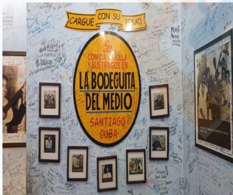
La Bodeguita del Medio

19h00 : Visite de La Casa de las Tradiciones , une salle de concert authentique et confortable située dans le quartier de Tívoli, où se produira un groupe représentatif de la musique traditionnelle de Santiago