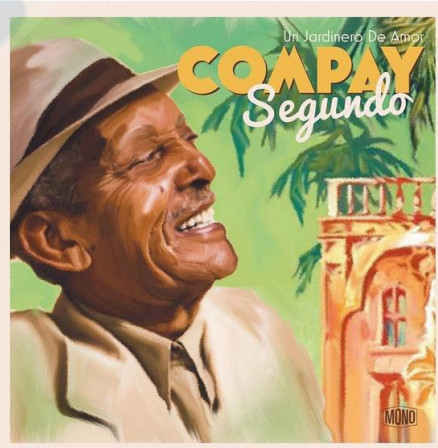
Segundo au cimetière Santa Ifigenia

11h30 à 13h00 : Visite des mythiques studios Siboney où les disques les plus authentiques du « Son Cubano » ont été enregistrés. Nous allons connaître de première main les détails et les singularités de l'enregistrement de thèmes musicaux