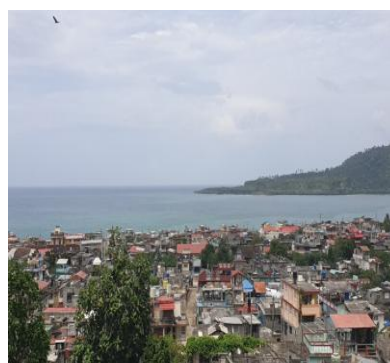
Ville de Baracoa

Hébergement et déjeuner à " Casa Toa " en profitant de diverses activités dans un environnement naturel idyllique sur les rives mêmes de la rivière Toa, la plus grande de Cuba.